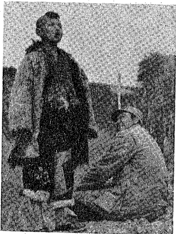
▲「邊塞熱」的例證：(上)油畫《喇嘛與鷹》，陳興祝繪，西藏五人畫展。(下)電影《黃土地》有邊塞風味。

經出現了西北文藝專刊和專家)，故此這個戲有它的重要意義。至於《黃土地》藝術上的得與失，我們沒有必要在此贅述，更值得一提便是該電影的導演在利用遠離八十年代的現實生活的四十年代陝北農村，採取了較為罕見的手法和含蓄的筆觸向觀眾傳達了有現實意義的思想內涵。恰巧因為陳並沒有徹底脫開漢族文化區域，影片才受到那麼多官方人士的重視和非議；這也是《黃土地》能夠在有眼光的都市青年當中引起共鳴的主要原因。